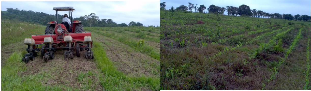
Figura 6. Plantio e desenvolvimento do milho em sistema de plantio direto (tratamento 2)