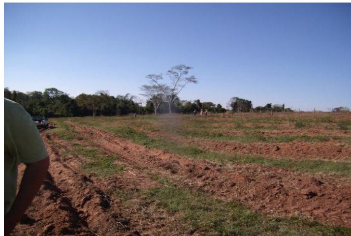
Figura 7. Abertura de sulcos após passagem de grade para plantio de espécies arbóreas nativas, seringueira, urucum e acerola no sulco (tratamentos 3 e 4).