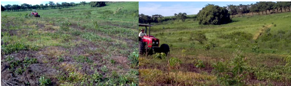
Figura 8. Plantio do milho sistema de plantio convencional (tratamento 3)