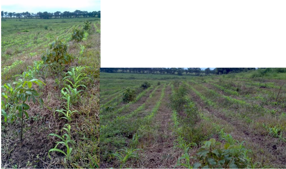
Figura 8. Desenvolvimento do milho e das espécies arbóreas em sistema de plantio direto