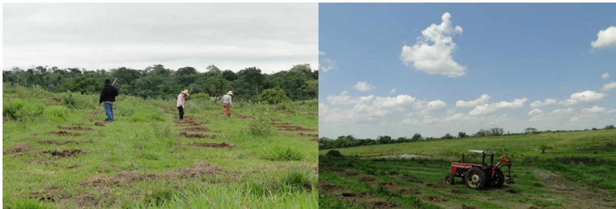
Figura 5. Abertura de covas para plantio de espécies arbóreas nativas, seringueira, urucum e acerola (Tratamentos 1 e 2).