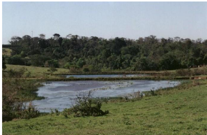
Figura 4. Vista geral da área antes do plantio em 2009.

perigo ou presumivelmente extinta). Nos plantios em área total, as espécies escolhidas deverão contemplar os dois grupos ecológicos: pioneiras (pioneiras e secundárias iniciais) e não pioneiras (secundárias tardias e climácicas), considerando-se o limite mínimo de 40% para qualquer dos grupos. O total dos indivíduos pertencentes a um mesmo grupo ecológico (pioneiro e não pioneiro) não pode exceder 60% do total dos indivíduos do plantio e nenhuma espécie pioneira pode ultrapassar o limite máximo de 20% de indivíduos do total do plantio sendo que nenhuma espécie não pioneira pode ultrapassar o limite máximo de 10% de indivíduos do total do plantio. Abaixo segue a seqüência de plantio na área que teve seu início em abril de 2011.